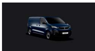
4PP0 | Imperialin sininen (perusväri)