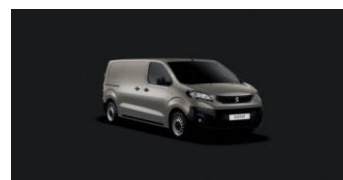
M0EU | Hiekan beige (metalliväri)