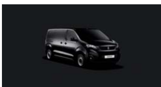
XYP0 | Onyxin musta