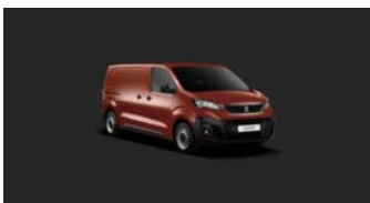
V7M0 | Turmalinin punainen (metalliväri)