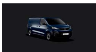
4PP0 | Imperialin sininen (perusväri)