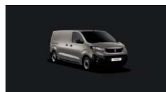
M0EU | Hiekan beige (metalliväri)