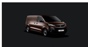
G6MO | Tammen ruskea (metalliväri)