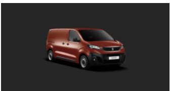
V7MO | Turmaliinin punainen (metalliväri)