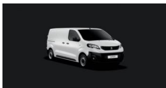
WPP0 | Ahtojaan valkoinen (perusväri)