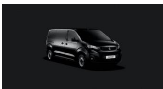
XYPO | Onyxin musta (musta)