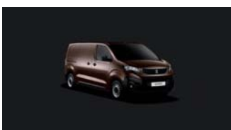
G6M0 | Tammen ruskea (metalliväri)