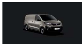
M0EU | Hiekan beige