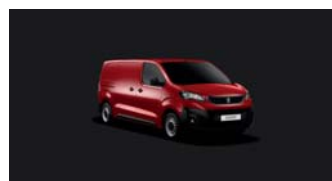
X9P0 | Polttavan punainen (perusväri)