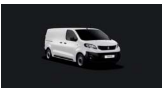
WPPO | Ahtajään valkoinen (perusväri)