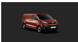
V7M0 | Turmaliinin punainen (metalliväri)