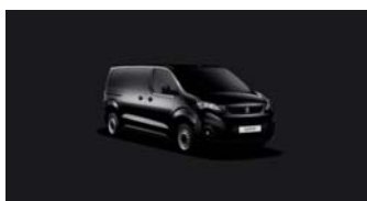
XYPO | Onyxin musta (musta)