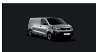
ZRMO | Alumiinin harmaa (metalliväri)