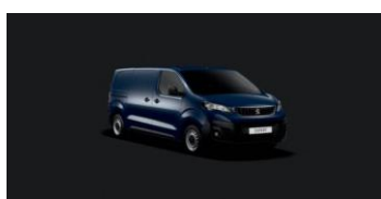
4PPO | Imperialin sininen (perusväri)