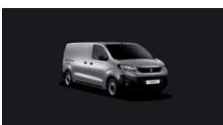
ZRM0 | Alumiinin harmaa (metalliväri)