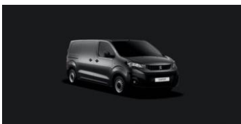
VLMO | Platinumin harmaa (metalliväri)