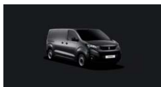
VLM0 | Platinumin harmaa