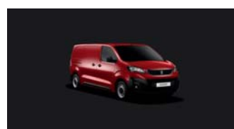
X9P0 | Polttavan punainen (perusväri)