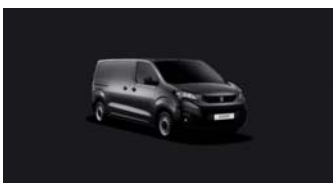
VLMO | Platinumin harmaa (metalliväri)