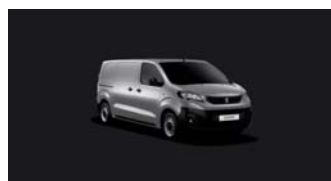
ZRMO | Alumiinin harmaa (metalliväri)