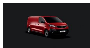
X9PO | Polttavan punainen (perusväri)