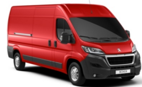
P01X | Tizianon punainen (pastelliväri)