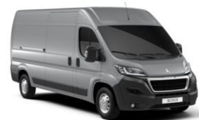
M0ZR | Alumiinin harmaa (metalliväri)