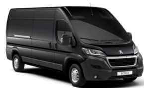
M0E9 | Grafiitin harmaa (metalliväri)