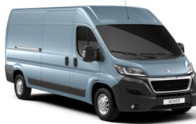
M04F | Lago Azzuro sininen (metalliväri)