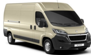
M0H8 | Kullan valkoinen (metalliväri)