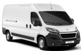
P0WP | Ahtojään valkoinen (pastelliväri)

Etusumuvalot Automaattinen ilmastointi Pysäköintitutka takana Peruutuskamera Kevytmetallivanteet 15" Nahkaverhoitu ohjauspyörä Metalliväri