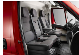
35FX | Darko kangasverhoilu