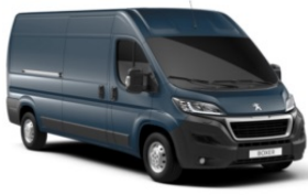
M0ZW | Raudan harmaa (metalliväri)