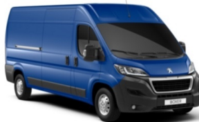
P05V | Linen sininen (pastelliväri)